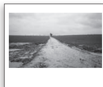
Plaine d'Artois, 2015.

Édition de prestige limitée à 18 exemplaires accompagnée d'un tirage photographique original