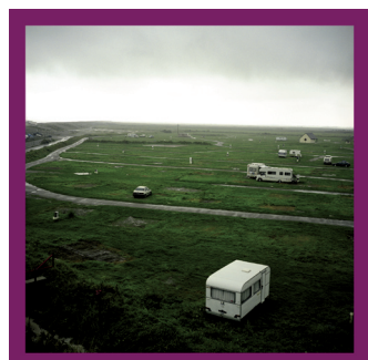
De quoi demain de Pascal Hausherr