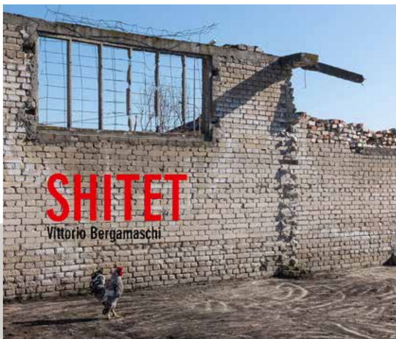
SHITET : « À vendre » en albanais.

L'Albanie est l'oubliée de l'Europe. Longtemps, elle en est restée le pays le plus fermé, le plus isolé. En s'y rendant, Vittorio Bergamaschi pensait retrouver l'empreinte d'un passé révolu inscrite dans le paysage et particulièrement celle laissée par la période communiste.